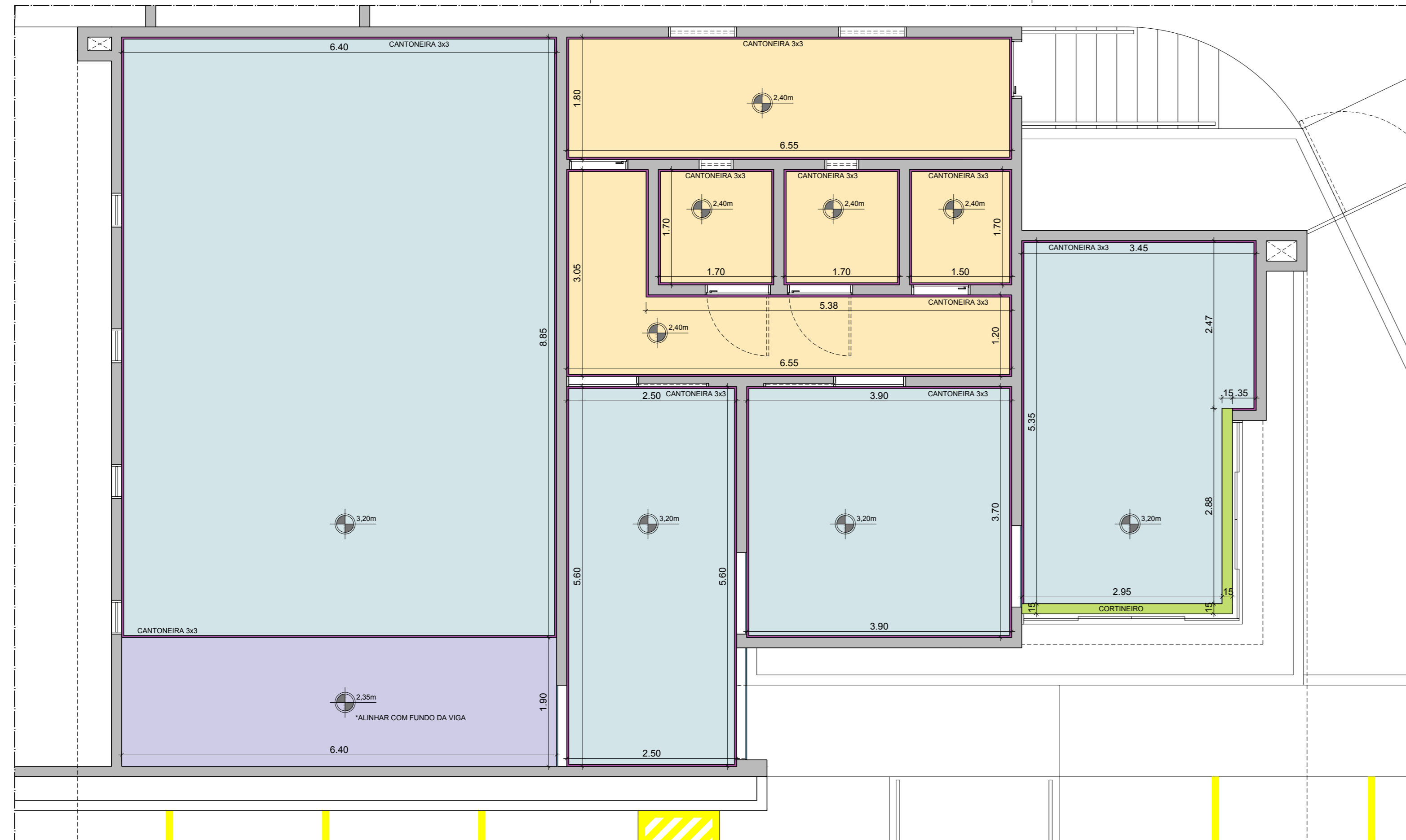
PLANTA BAIXA - GESSO ESCALA 1/100