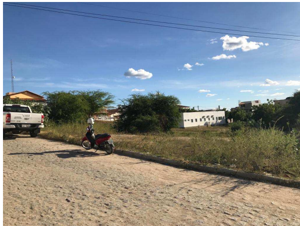
Figuras de 06 a 10: Fotos demonstrando o terreno onde será instalada futura sede do Crea Pombal.